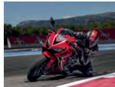
La CBR650R en action.

Depuis 1992 et la ST 1100, mieux connue sous le nom de Pan European, les modèles Honda sont de plus en plus nombreux à bénéficier d'un dispositif appelé HSTC, pour Honda Selectable Torque Control – littéralement : contrôle de couple moteur déconnectable. Ce système surveille en permanence la vitesse des roues avant et arrière par l'intermédiaire de capteurs intégrés à l'ABS. Dès que la roue arrière commence à tourner nettement plus vite que l'avant, il réduit l'arrivée d'essence au moteur afin de limiter le patinage. En 2019, la CBR650R a été la première sportive Honda de moyenne cylindrée à inaugurer cette technologie. Le pilote peut la désactiver à souhait.